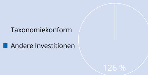
2. Taxonomie Konformität der Investitionen ohne Staatsanleihen*